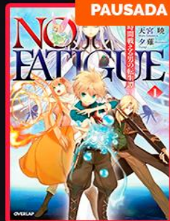
PAUSADA NO FATIGUE