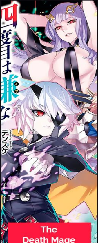
The Death Mage ACTIVA