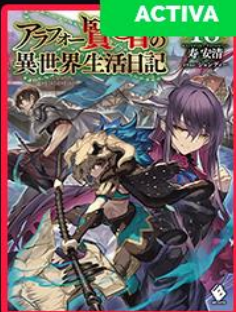
ACTIVA Arafoo Kenja no Isekai Seikatsu Nikki