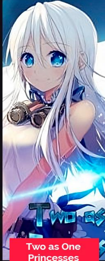
Two as One Princesses ACTIVA