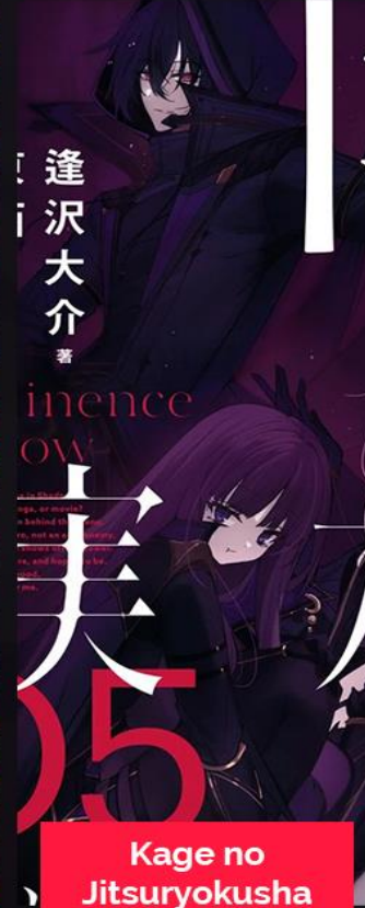
Kage no Jitsuryokusha ACTIVA