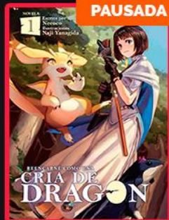
PAUSADA Reincarnated as a Dragon Hatchling