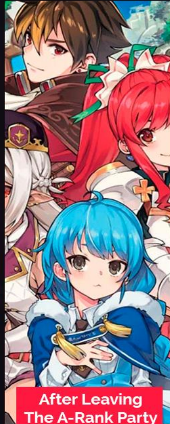
After Leaving The A-Rank Party ACTIVA